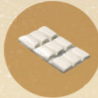
10 pcs tack-it (untuk menempelkan kartu stick-on)