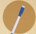
1 pcs erasable marker