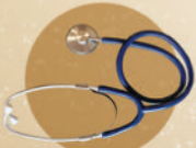
1 pcs stetoskop