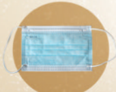
1 pcs masker medis anak