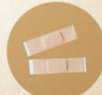
2 pcs plester medis