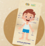
1 pcs poster anatomi tubuh