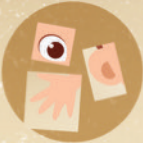
1 set kartu stick-on bagian tubuh