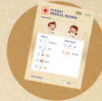
1 lbr medical check-up card