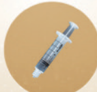
1 pcs alat suntik