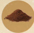
1 botol bubuk copy